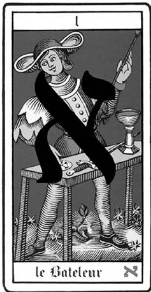
La forme du personnage reprend la forme de la lettre Aleph.

Tout dans cet arcane semble être orchestré dans la magie du 1 ! Les “dés chiffrés” sur la table du Bateleur nous conduisent grâce à l'étymologie au mot Hasard (de l'arabe az-zahr , le dé).